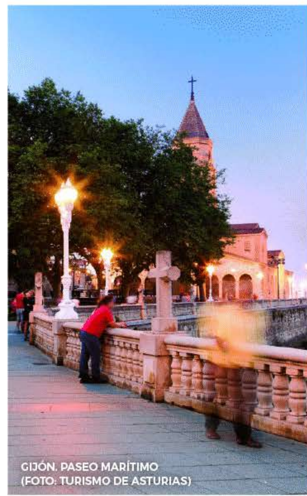
GIJÓN. PASEO MARÍTIMO